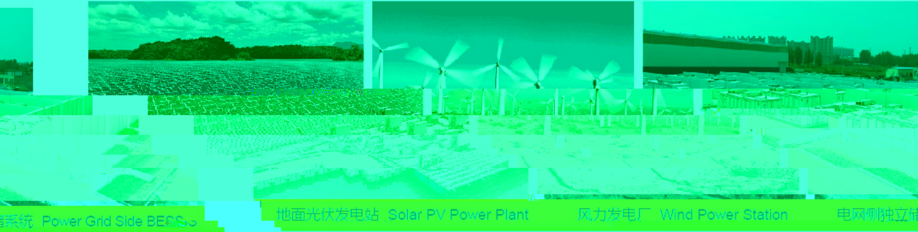
电网侧独立储能系统 Power Grid Side BESS